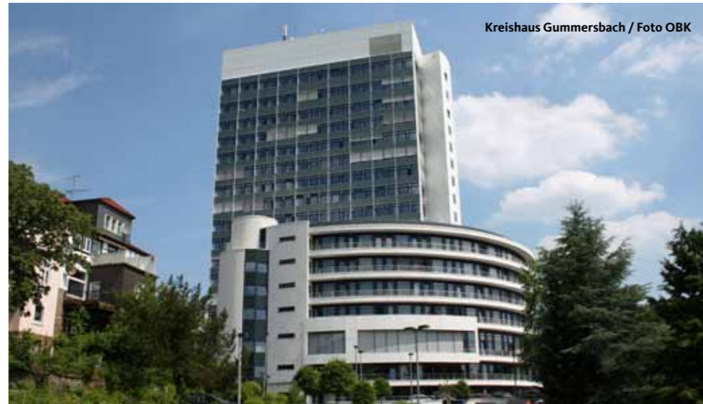
Kreishaus Gummersbach

am 25. Mai 2014 werden Sie mit Ihrer Stimme über die Zukunft des Oberbergischen Kreises und der Städte und Gemeinden anlässlich der Kommunalwahl entscheiden. Mit der Wahl der Bürgermeister in vielen Städten und Gemeinden, des Kreistags und der Stadt- und Gemeinderäte für die nächsten 6 Jahre werden die Weichen für die Entwicklung unseres Kreises gestellt. Der Oberbergische Kreis kann eine gute