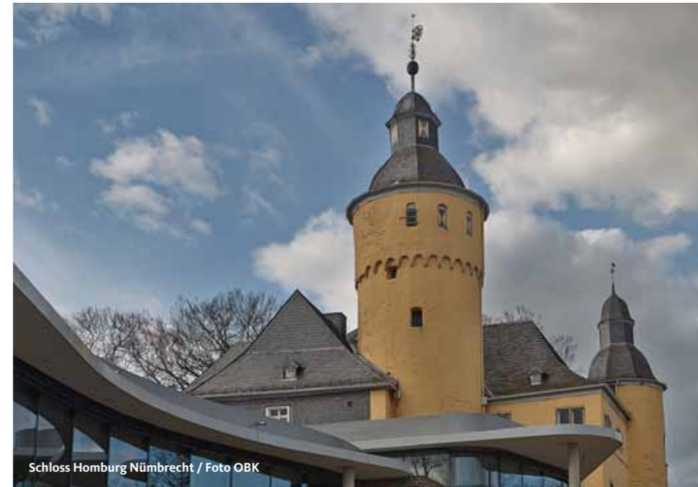
Schloss Homburg Nümbrecht