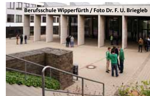
Berufsschule Wipperfürth