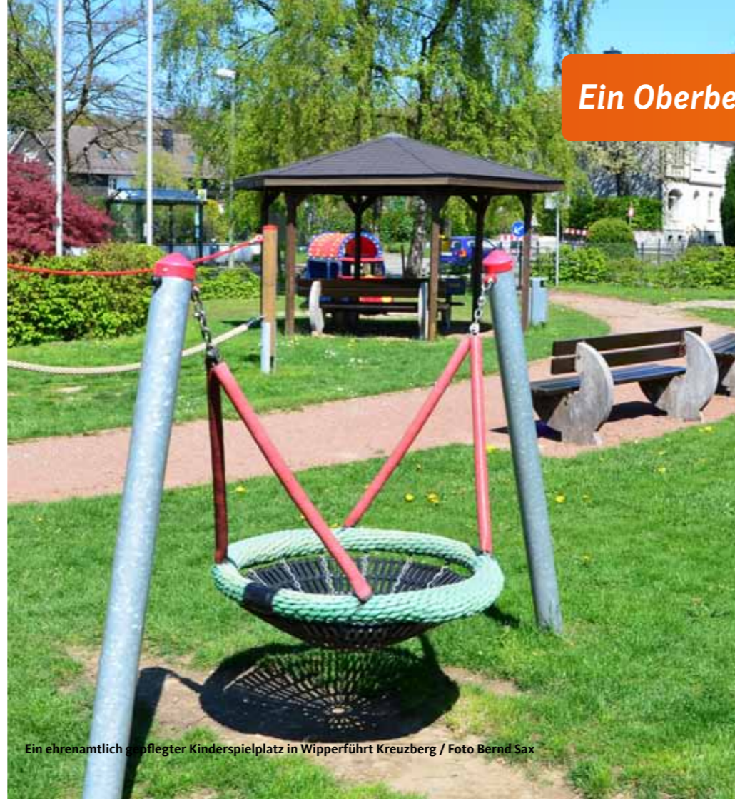
Ein ehrenamtlich gepflegter Kinderspielplatz in Wipperfürth Kreuzberg